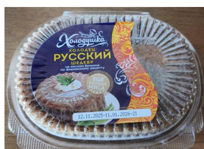
Х-ц Русский Шедевр свинина 250гр