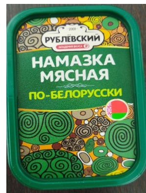
Намазка мясная по Белорусски Кат.Б ТУ 150г