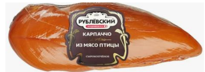
Карпаччо из птицы с/к в/с ~200гр