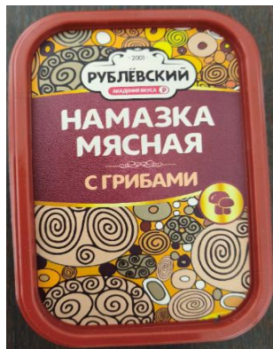
Намазка мясная с грибами Кат.Б ТУ 150г