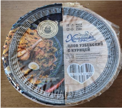
Плов узбекский с курицей 250гр