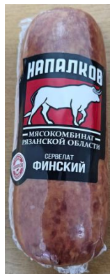
Сервелат Финский Кат.Б ТУ ~400гр