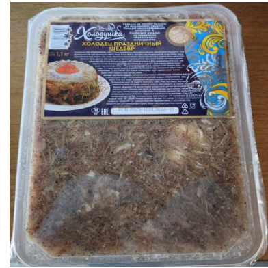
Х-ц Праздничный Шедевр свин/кур 1100гр