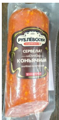
Сервелат Коньячный Кат.Б ТУ 300гр