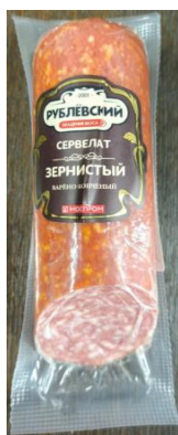
Сервелат Зернистый Кат.В ТУ 300гр