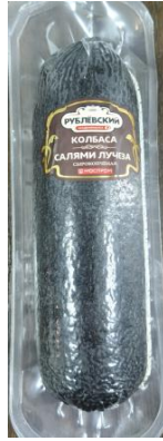
Салями с/к Лучеза Кат.А ТУ ~750гр