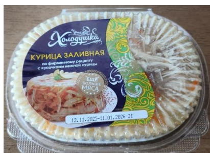
Курица заливная 250гр