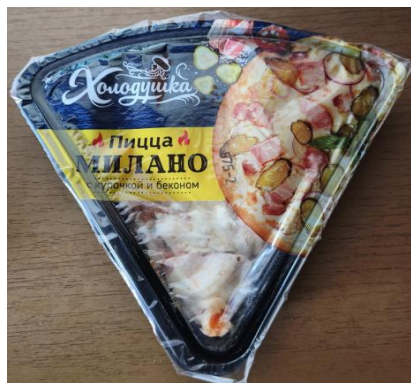
Пицца Милано курица/бекон 160гр