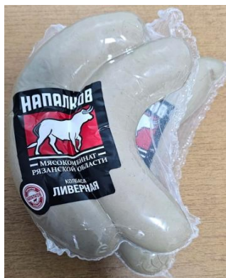
Ливерная Славянская Кат.Б ~450гр