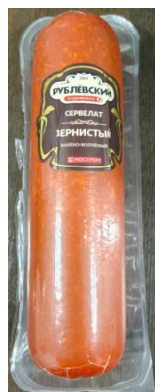
Сервелат Зернистый Кат.В ТУ ~900гр