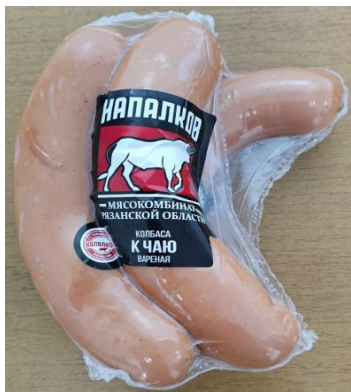
Колбаса К Чаю Кат.Б ТУ ~400гр