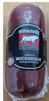
Колбаса Московская Кат.А ГОСТ ~500гр