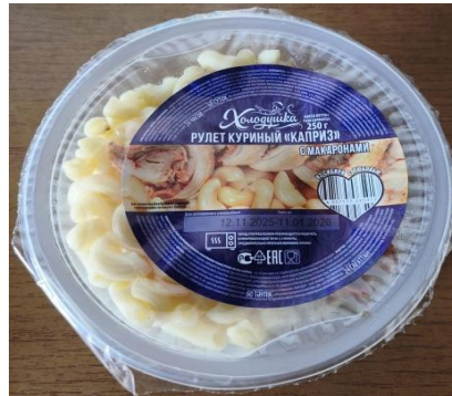
Рулет куриный "Каприз" с макаронами 250гр