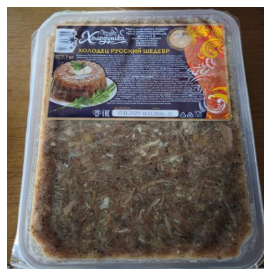
Х-ц Русский Шедевр свинина 1100гр