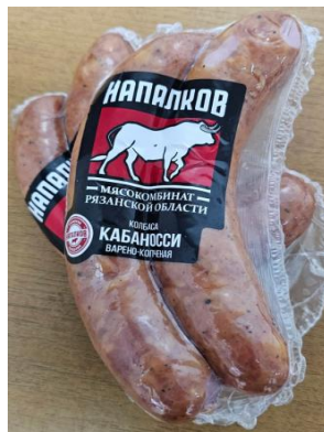
Колбаса Кабаносси Кат.В ТУ ~400гр