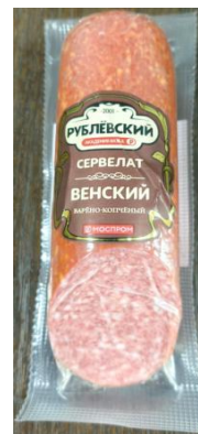
Сервелат Венский Кат.В ТУ 300гр