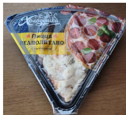
Пицца Неаполитано пепперони 160гр