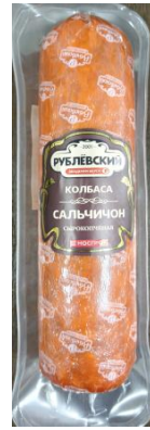
Сальчичон с/к Кат.Б ТУ ~750гр