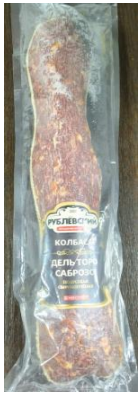
Дель Торо Саброзо Кат.А ТУ ~1,2кг