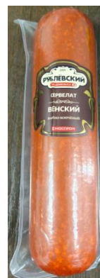
Сервелат Венский Кат.В ТУ ~900гр