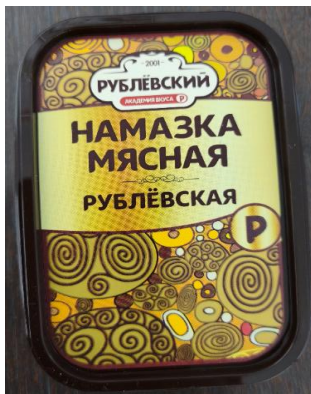
Намазка мясная Рублёвская Кат.Б ТУ 150г