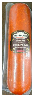
Сервелат Коньячный Кат.Б ТУ ~900гр