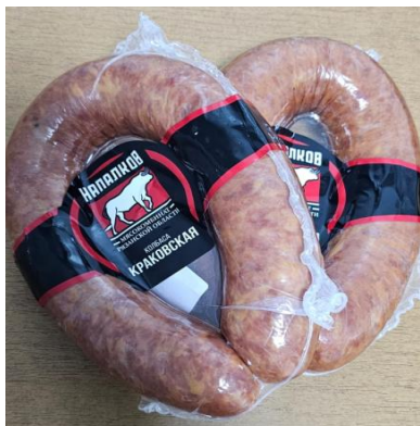
Колбаса Краковская Кат.Б ГОСТ ~500гр