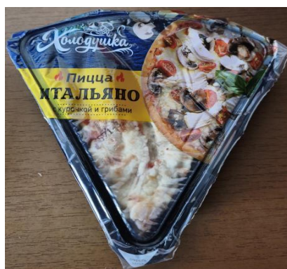
Пицца Итальяно курица/грибы 160гр