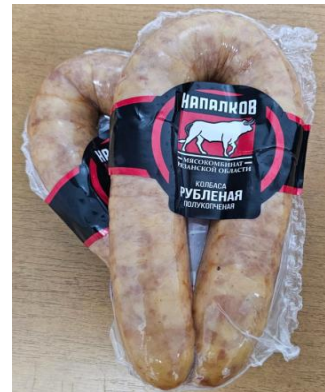
Колбаса Рубленая п/к Кат.В ТУ ~400гр